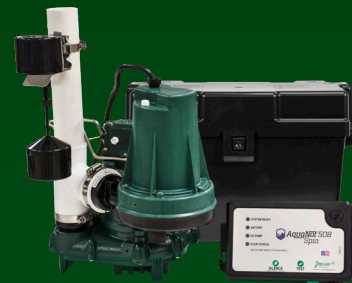
Se muestra el ProPak 508-0006