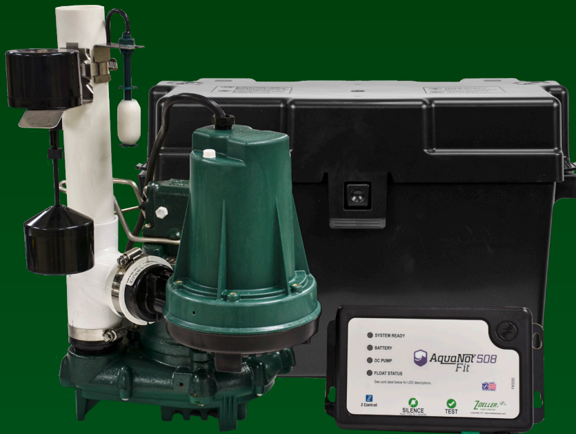
ProPak 508-0015 mostrado

El sistema cuenta con dispositivo Z Control® con capacidad para auto testeo, brindando comodidad y confianza en la protección contra inundaciones